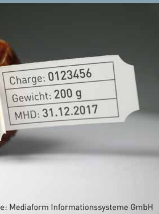
Mediaform Informationssysteme GmbH

sind und somit den Produktionsprozess effizient unterstützen.